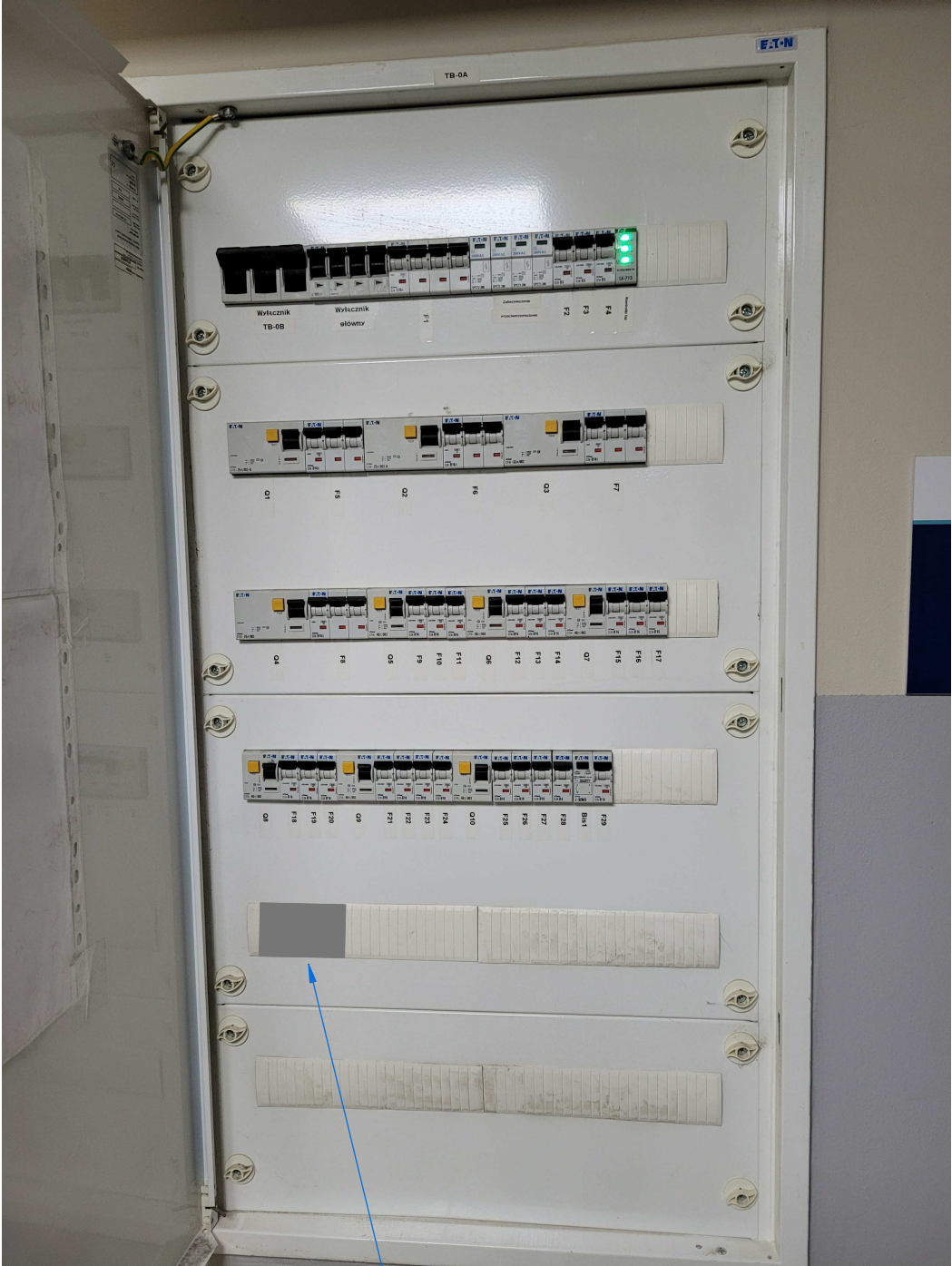
Tablica bezpiecznikowa TB-0A w piwnicy budynku szkoły, w której zabudować modułowy rozłącznik bezpiecznikowy 63A. Z tablicy wyprowadzić linię kablową YKY 4x10mm 2 (zabezpieczoną wkładką bezp. 50A) do zasilania złącza kablowego boiska